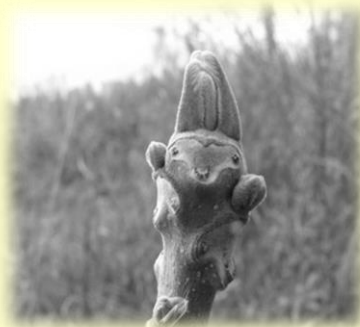
オニグルミの冬芽