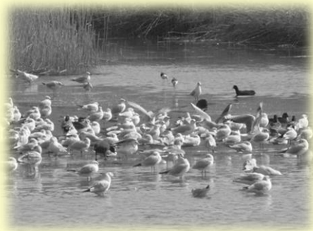
ユリカモメやオオバン

寒い北風にも負けずに、ちよっぴり厚着をして青空の下、河原を散策してみてください。きっといろいろな発見があるはずですよ。