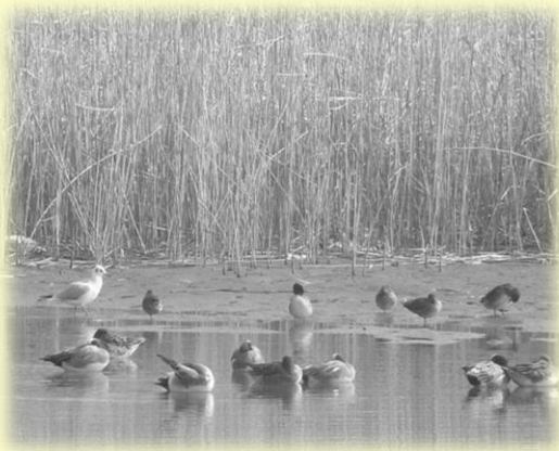
アシ原周りのヒドリガモたち

冬の日、とくにお天気の良い日には河原をお散歩してみてください。きっとたくさんの生きものたちに出会えることでしょう。