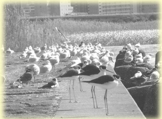
セイタカシギとユリカモメたち