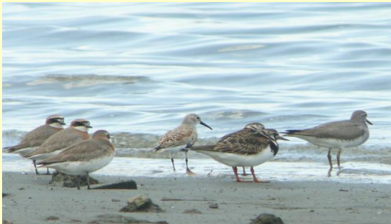
順にメダイチドリ、ハマシギ、キョウジョシギ、キアシシギ