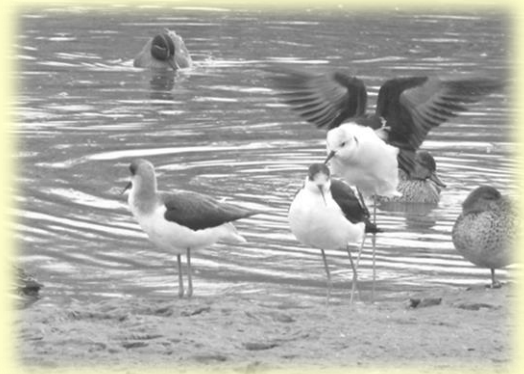
セイタカシギ(手前)とコガモ(奥)

アシ原の色が枯れ草色に変わる頃、北の国からたくさんの冬鳥たちがやってきます。特にカモのなかまは、ここ多摩川河口でやがて来るきびしい冬を越そうと、オナガガモ、ヒドリガモ、コガモ、マガモ、キンクロハジロ、ホシハジロ、スズガモ、などたくさんの種類がやってきます。