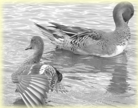
オナガガモのオス(奥)